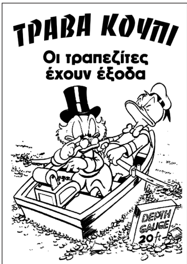
Το σκίτσο είναι από το: http://antistachef.wordpress.com/