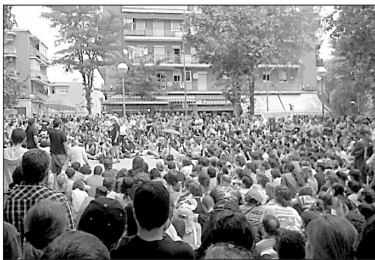
Φωτο από συνοικιακή συνέλευση σε γειτονιά της Μαδρίτης